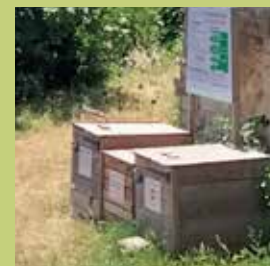
Au pied de la Tour de Guet