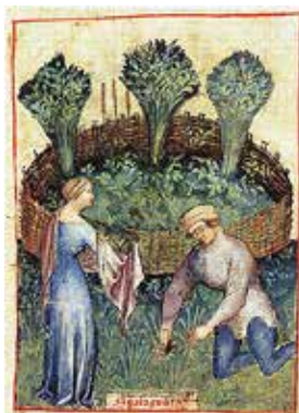
La culture des asperges dans le Tacuinum sanitatis , XVe siècle.

Le plus ancien texte connu mentionnant la culture de l'asperge en France est un inventaire du potager des chanoines de la collégiale Saint-Amé de Douai, écrit vers 1469 à la suite d'un procès. Le document appartient à la région des Hauts de France.