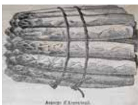
Illustration de l'asperge Argenteuil (Catalogue Vilmorin 1900)