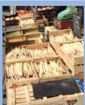
Les producteurs du vaclus (Aujourd'hui)

Le midi cultivait l'asperge au commencement du XVIe siècle.