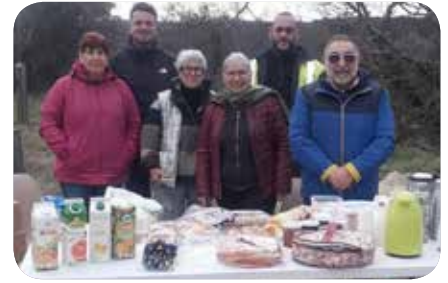
L'équipe LES AMIS DE MORMOIRON qui a mené la journée nettoyage

Une bonne vingtaine de personnes s'est retrouvée autour du plan d'eau pour l'opération « Retroussons-nous les manches ». Organisée par l'association « Les Amis de Mormoiron », cette initiative a rassemblé des membres d'associations locales, tous motivés par une même envie : prendre soin de notre cadre de vie.