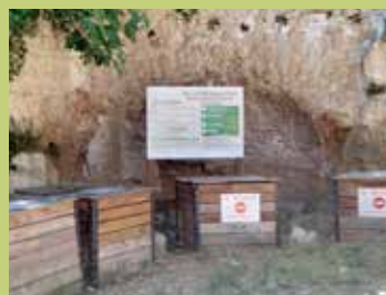
Calade du Moulin à l'huile