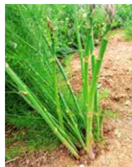
Sélection variété mené (INRA 1960)